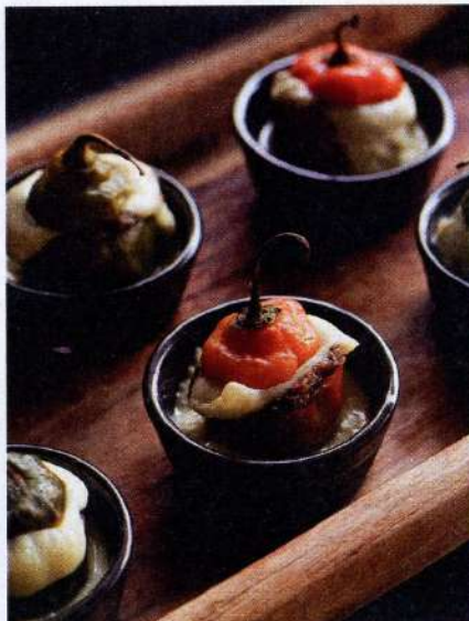
LA CARTA ES REELABORADA ESTACIONALMENTE, PRIORIZANDO LOS TIEMPOS DE DISPONIBILIDAD DE CADA PRODUCTO. DER., EL ROCOTO RELLENO DE CIRQA.

E l alimento restaura. Hace recordar el estado idóneo del cuerpo y del alma, a veces llevándolo a un nivel superior. Por eso la palabra latina restaurabo ('restableceré') lucía pintada en el letrero del primer restaurante de París, en el siglo XVIII.