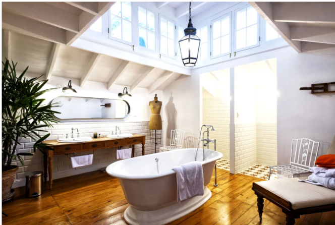
Hotel Villabarranco.