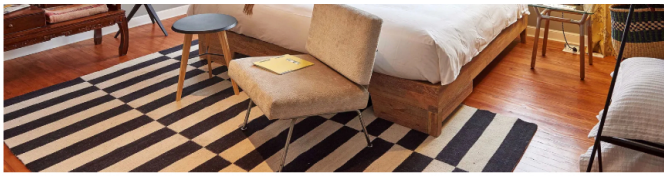
Hotel Atemporal.