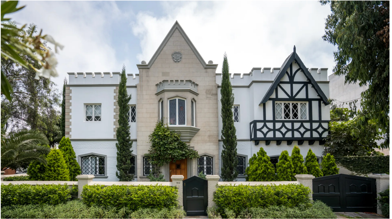
Hotel Atemporal.