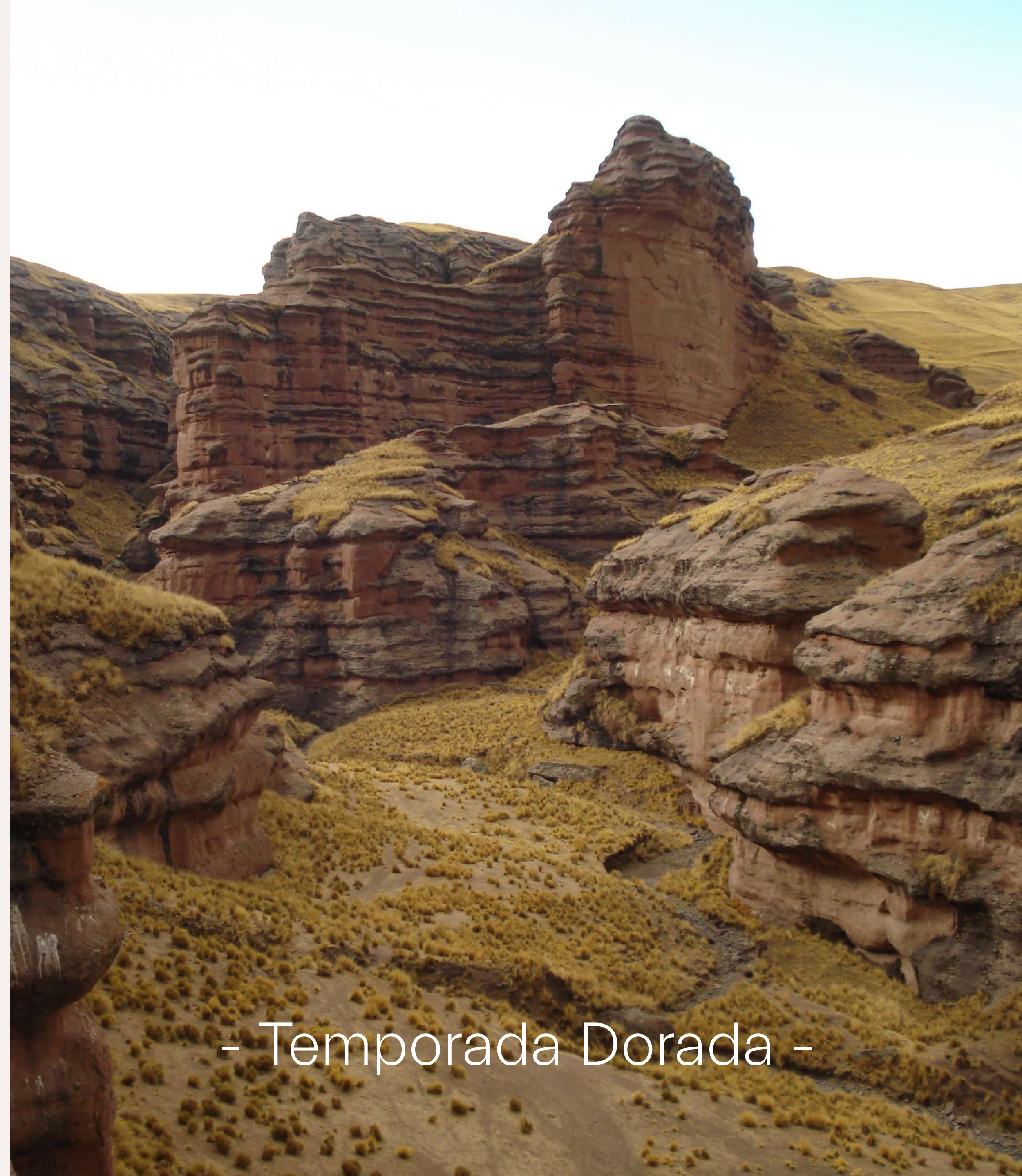
- Temporada Dorada -