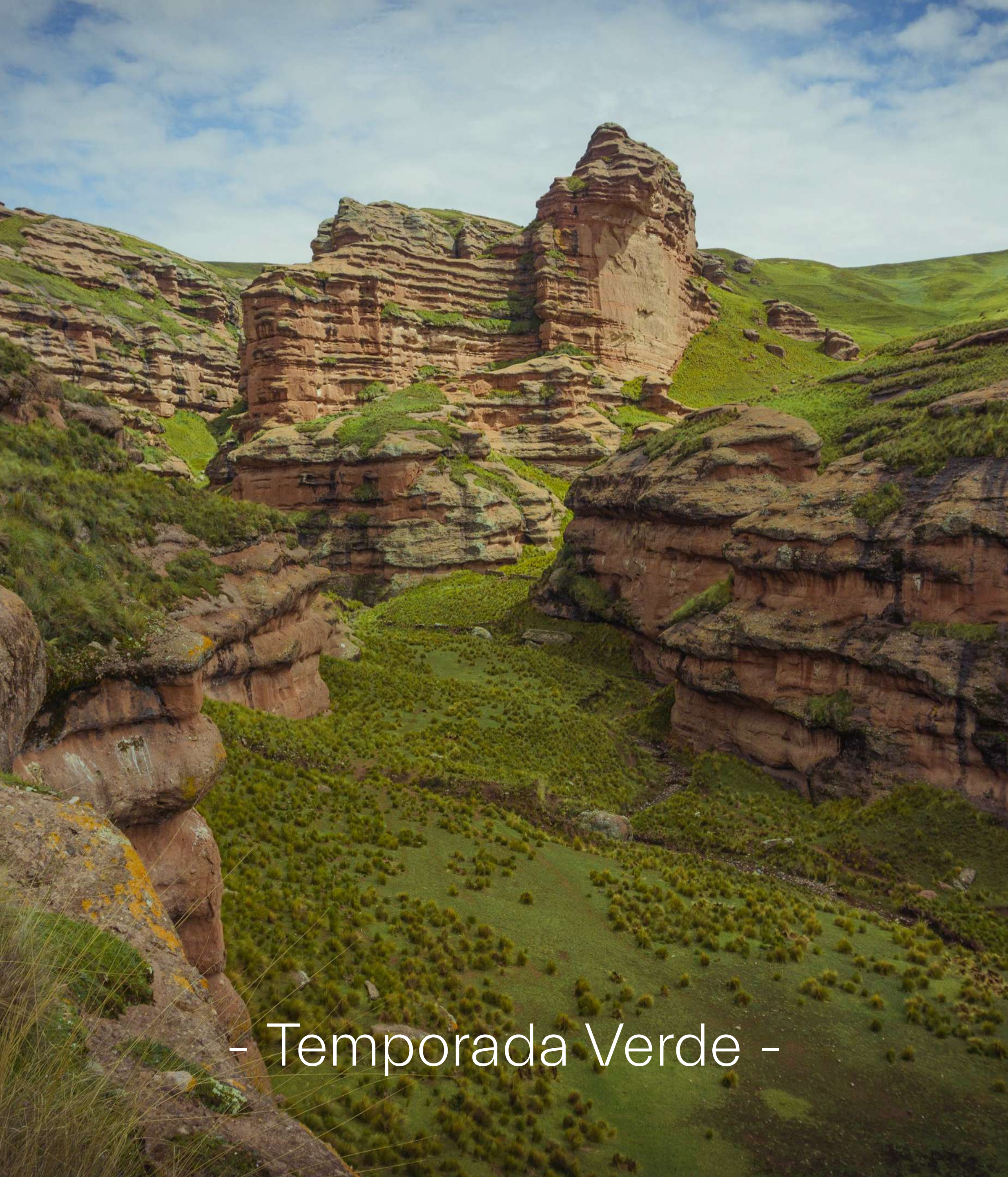
- Temporada Verde -